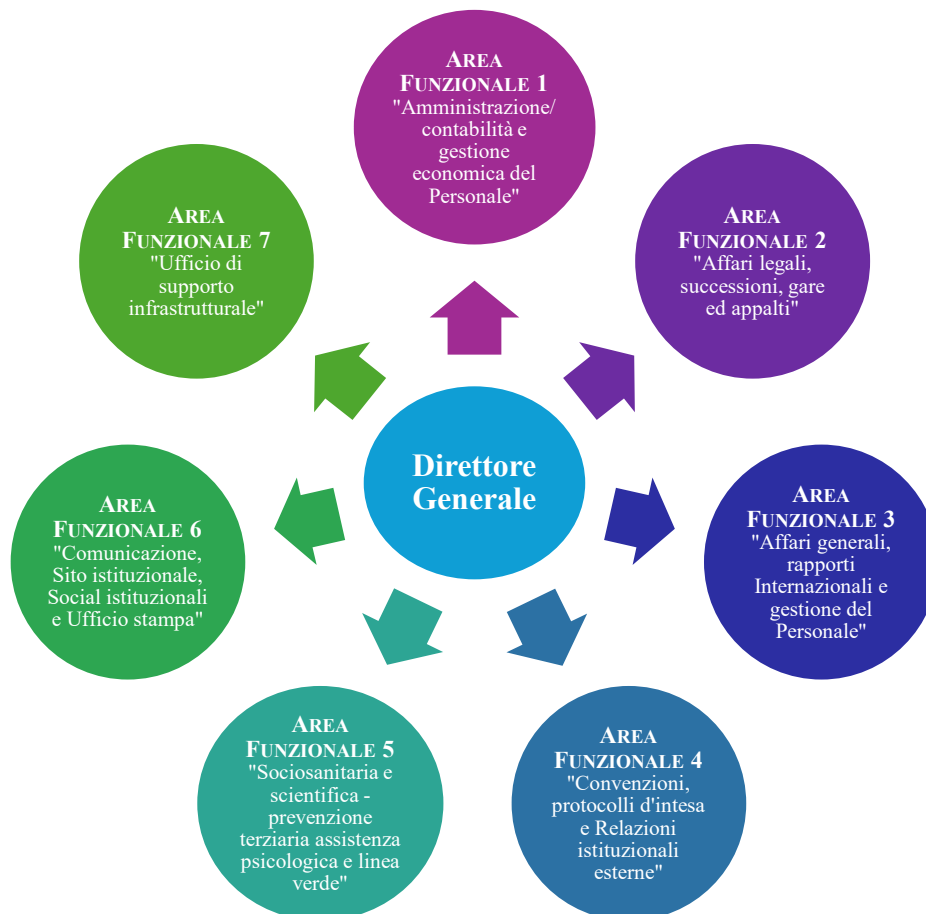
Figura 4. Schema del funzionigramma LILT

Sono state previste sette aree funzionali ed un ufficio di supporto infrastrutturale dopo l'assunzione del nuovo personale.