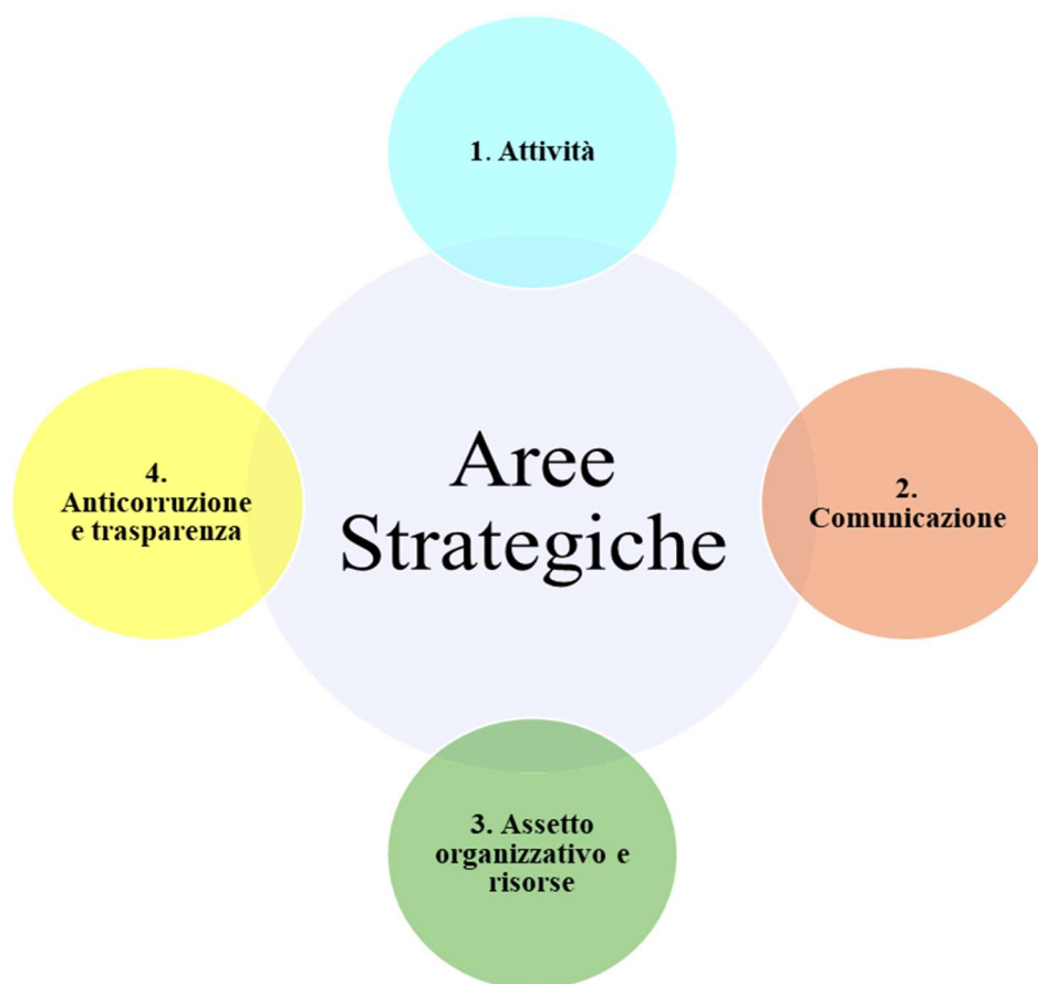
Figura 3. Schema Aree Strategiche

Il sistema di indicatori adottato e la definizione dei target permettono il monitoraggio continuo e la valutazione della performance , individuando di volta in volta aree di forze e di debolezza, con la possibilità di agire su queste ultime per incidere sull' output di periodo.