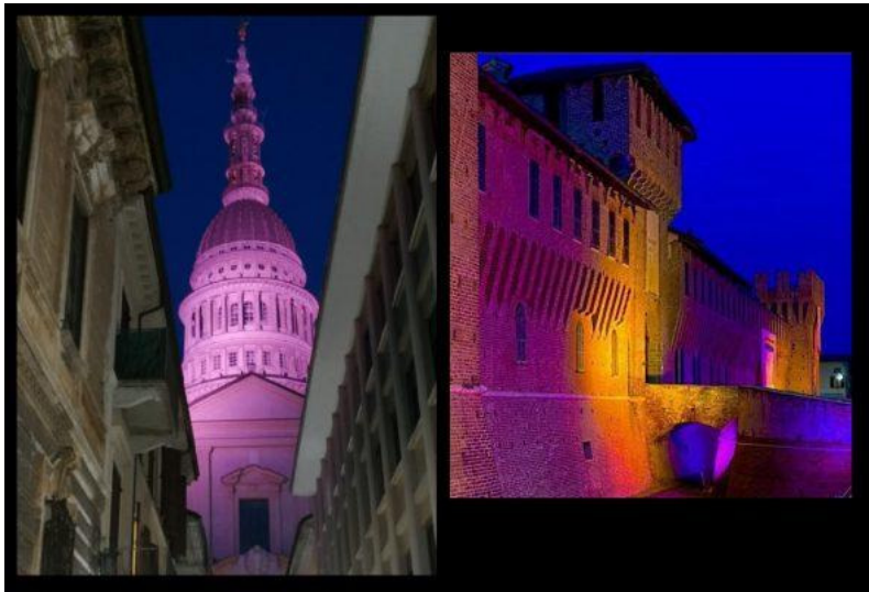
Ad ottobre i simboli di Novara illuminati dal rosa di Lilt

Nonostante le grandi difficoltà dovute alle restrizioni imposte dalle misure anti Covid, sono state 250 le donne in provincia di Novara, incontrate a ottobre per la visita senologica e il counseling sulla prevenzione del tumore al seno.