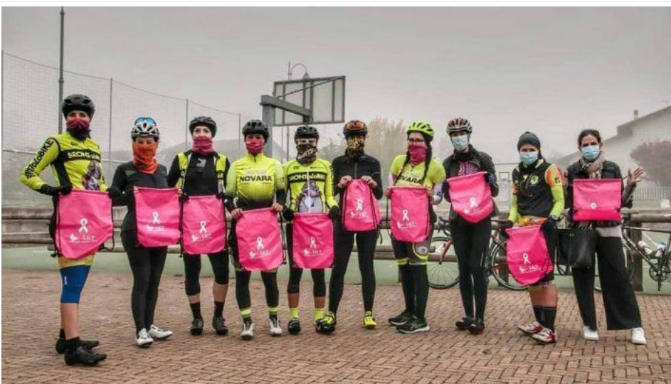
Le ragazze del Gruppo Ciclistico '95

L’“Ottobre in Rosa” ha coinvolto numerose Amministrazioni comunali del territorio provinciale aderenti all’iniziativa “Comuni in Rosa per Lilt”: Novara, Galliate, Gargallo, Sozzago, Varallo Pombia, Trecate, Romentino, Cameri, Momo, Prato Sesia, Cressa, Borgo Ticino, Briga Novarese, Oleggio Castello, Gozzano, Mandello Vitta. I palazzi comunali e altri luoghi simbolo (uno su tutti la cupola di San Gaudenzio a Novara) sono stati illuminati di rosa e sono state realizzate diverse iniziative sempre garantendo la massima sicurezza.