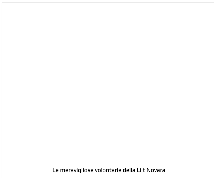
Le meravigliose volontarie della Lilt Novara

Non ultime in ordine di importanza, le preziosissime e insostituibili volontarie Lilt Novara, oltre che gli sponsor MedicivA, Comunità Giovanile Lavoro, Grafiche Desy.